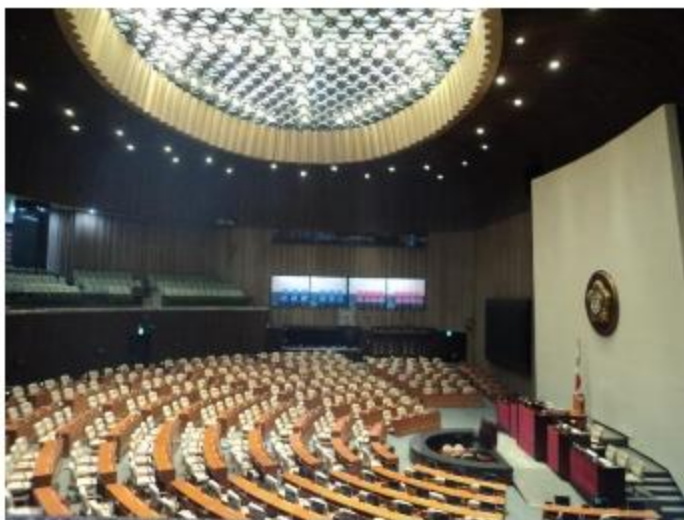
๒. ศึกษาผลงาน ณ Ewha Womans University Elementary School